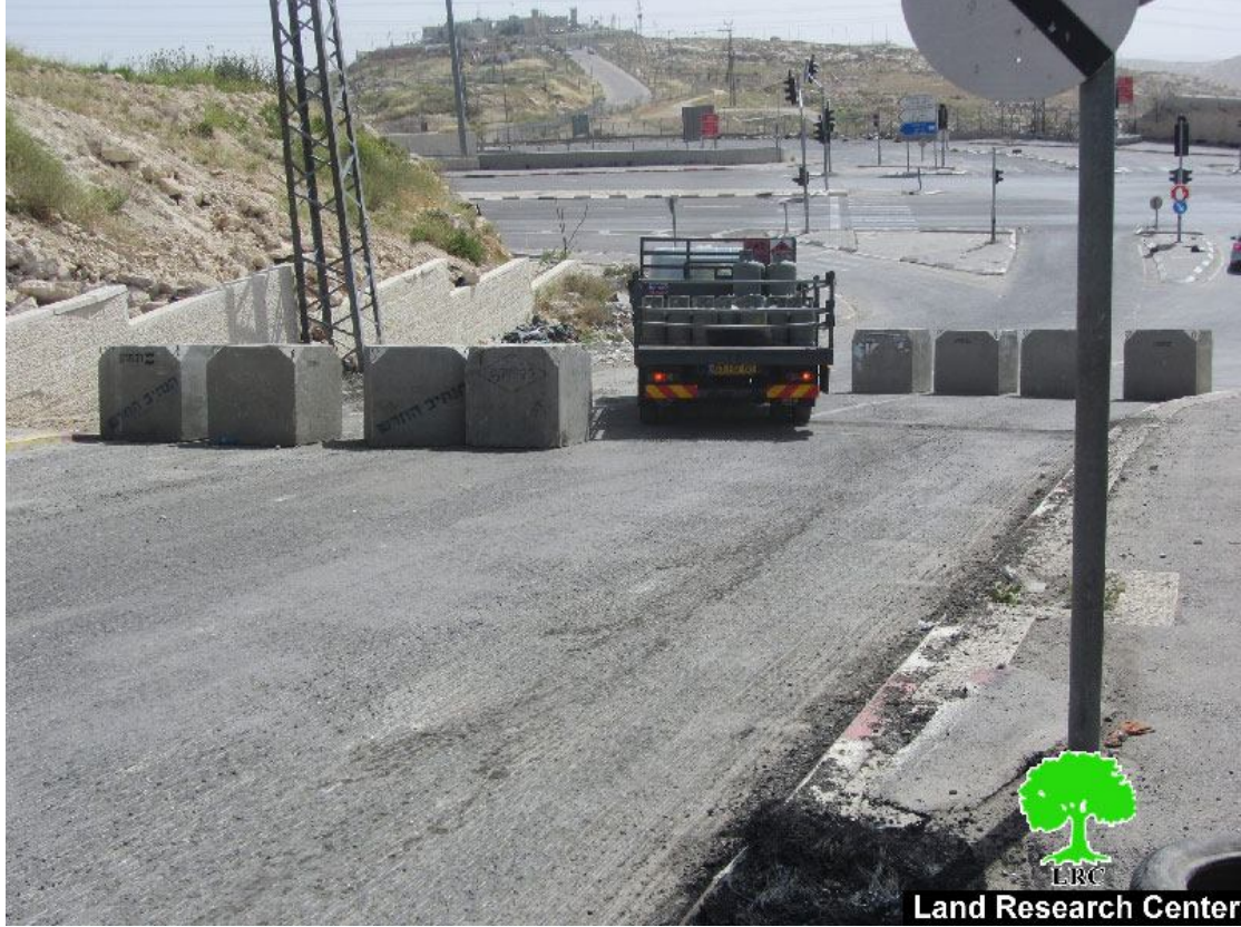
مدخل قرية العيسوية الشرقي المغلق